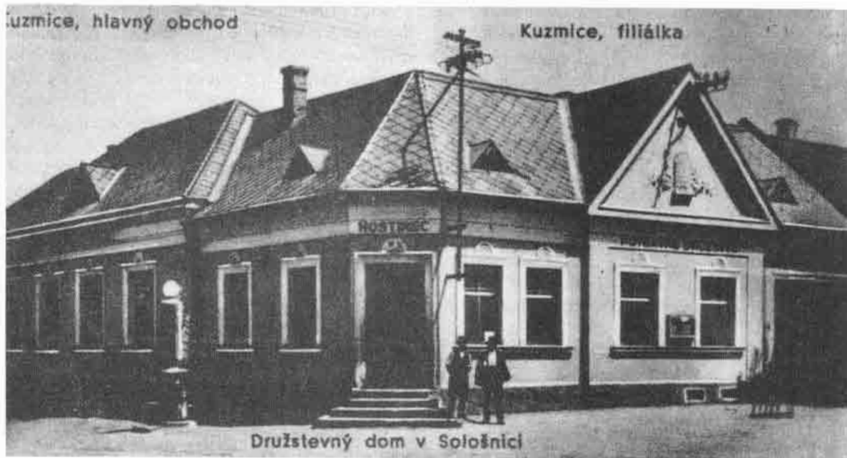
Družstevný dom v Sološnici, okr. Senica. Vybudovaný r. 1927. Budova mala v tom období výčapnú a obchodnú miestnosť, hostovskú izbu, byt pre vedúceho obchodu, kultúrnu miestnosť, miestnosť pre úverné družstvo a skladište.

slávnostiach. Dôležitá bola v tomto smere zakladajúca schôdza, ktorá obsahovala oboznámenie sa s podmienkami združenia, voľbu funkcionárov, upresnenie plánov na zabezpečenie predajnej miestnosti.