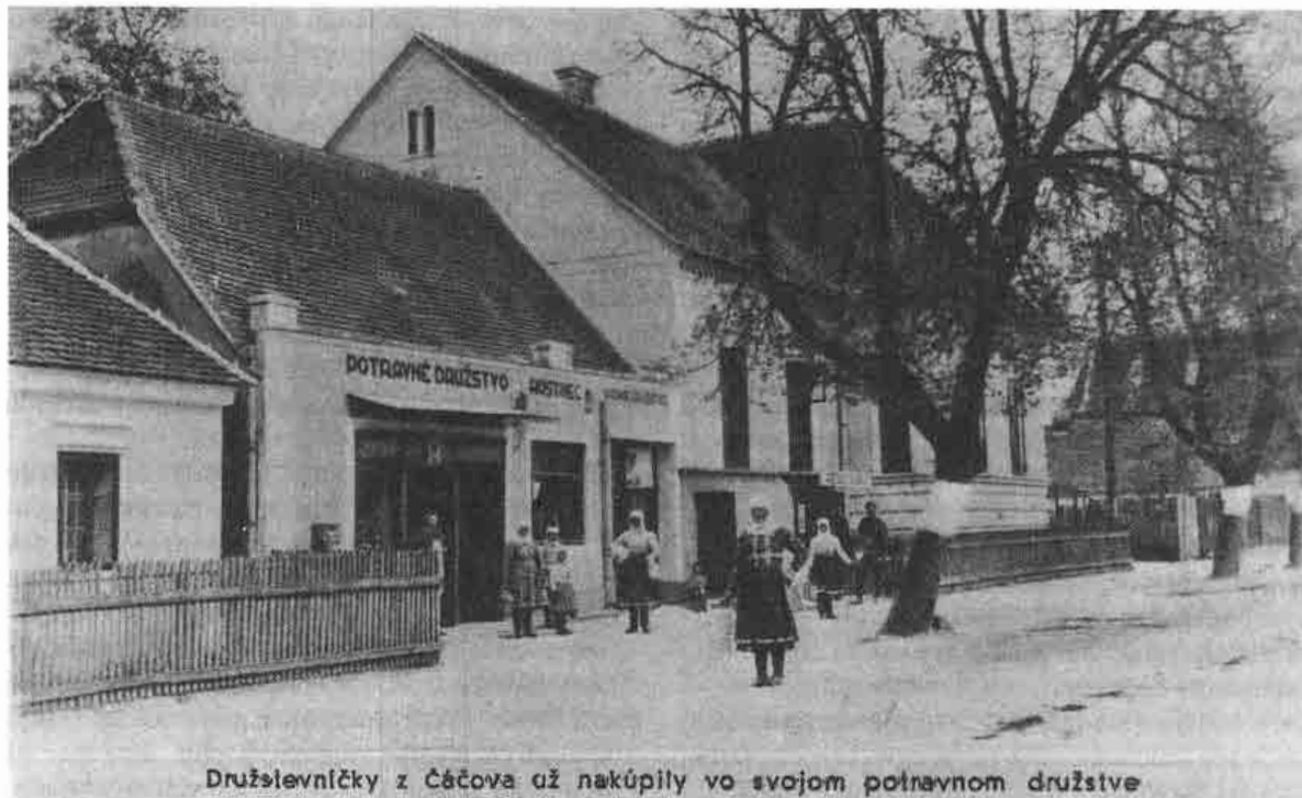
Družstevníčky z Čáčova už nakúpily vo svojom potravnom družstve

Budova Potravného a úverného družstva v Čáčove, okr. Senica v 1. pol. 20. stor.